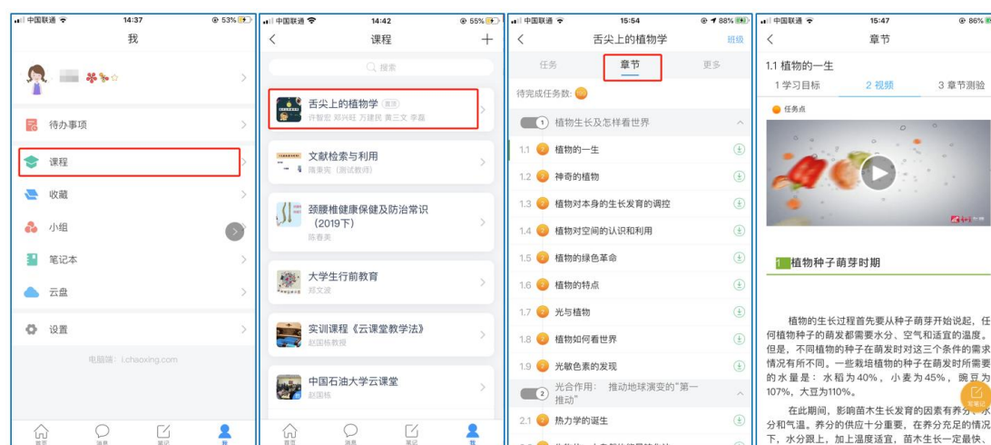
图 7 移动端课程学习

打开学校在线课程平台 ( http://s.zuel.edu.cn/ ), 按照提示“登录”进入用户界面, 使用统一身份认证登录, 进入主页。点击底部菜单“我”—“课程”, 可进入课程列表, 再选择要学习的课程, 即可进入课程详情, 章节内容即为学习内容, 在章节学习过程中可随时写笔记。