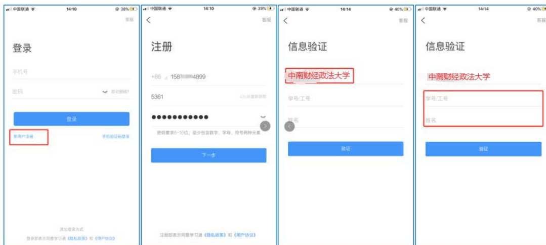
图 2 注册—信息验证流程