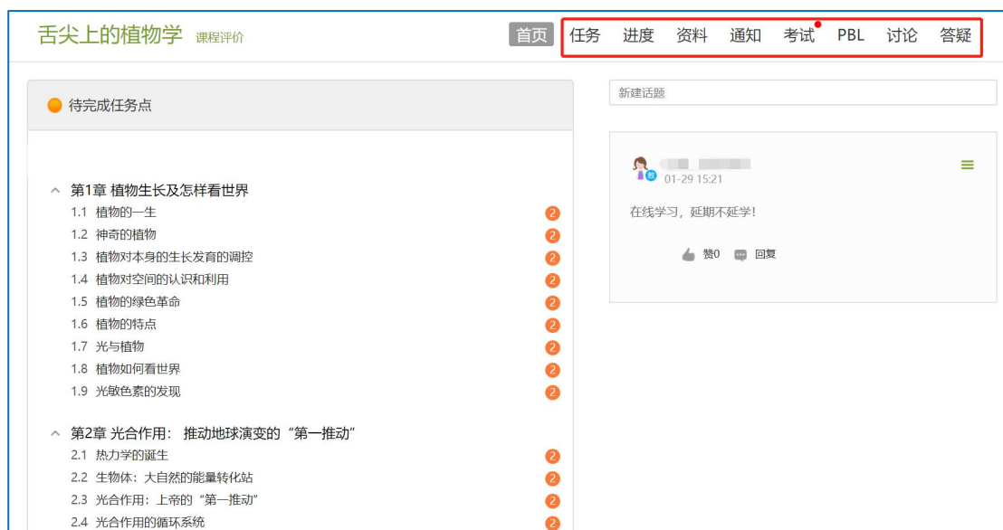
图 6 进行课程学习