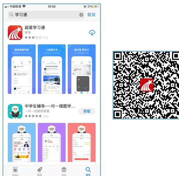
图 1 下载“学习通”