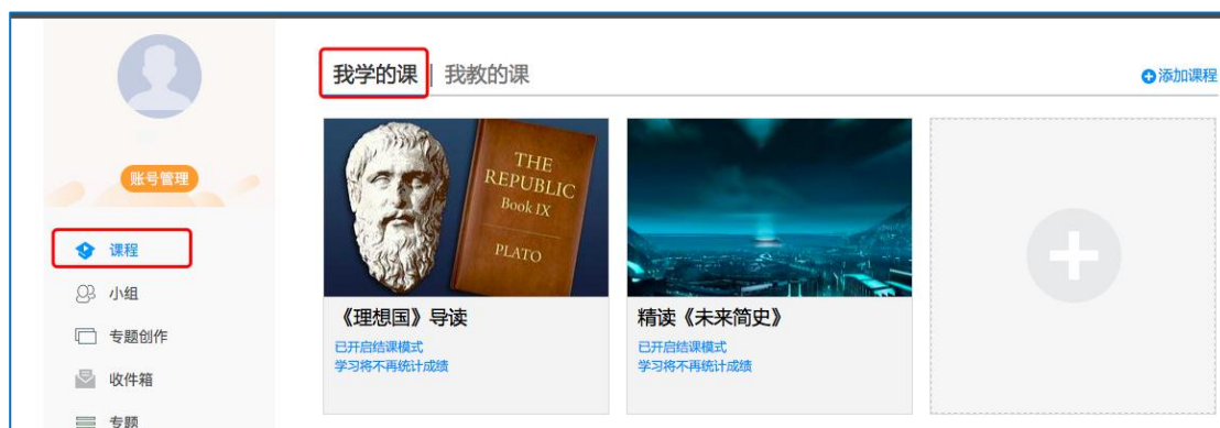
图 5 点击进入课程

进入课程后，可查看章节列表的知识点，右上角为学习导航，可即时收到老师发布的学习任务、测验、作业及考试，查看自己的学习进度，并进行资料中的拓展学习，也可参与讨论、提问等。